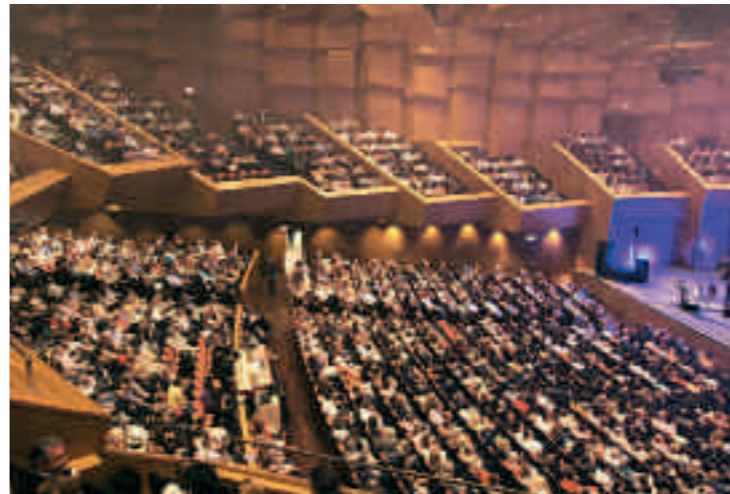
Κοσμοπλημύρα για τὸν Salvatore Adamo στὴν Αἴθουσα Φίλων Μουσικῆς.

γάπη καὶ συντροφικότητα ἦλθαν «αγκαζέ» για νὰ θυμηθοῦν, ἀκούγοντας καὶ χειροκροτώντας, τὸν Adamo τῶν ἀξέχαστων τραγουδιῶν. Στὴν εἴσοδο, στο πλευρὸ τοῦ γενικοῦ διευθυντοῦ τοῦ ΟΜΜΑ κ. Νίκου Μανωλόπουλου ἡ πρόεδρος τοῦ ἰδρύματος κ. Ασπασία Λεβέντη, με τὰ μέλη τοῦ Δ.Σ., ὑποδεχόταν τοὺς καλεσμένους καὶ τὶς ἐπίσημες παρουσίες. Οἱ σκάλες καὶ τὰ φουαγιέ πλατεῖαι καὶ θεωρεῖων πλημμυρισμένα ἀπὸ κόσμο, μόνη «σκιά» ὅτι δὲν πρόλαβαν τὸ τύπωμα τοῦ προγράμματος. Ἀλλὰ, ὅπως ἀποδείχθηκε, αὐτὸ δὲν ἦταν ἀπαραίτητο, γιατί ο ἴδιος ο Salvatore τα παρουσίαζε, μιλοῦσε γι' αὐτὰ, για τὴν ἐποχὴ που τὰ τραγοῦδῃσε, με τὸν χρόνο νὰ μὴν ἔχει ἀγγίξει καθόλου τὸν ἴδιο, πέρα ἀπὸ τὰ γκριζὰ μαλλιά του. Στὰ 65 τοῦ χρόνια παραμένει λεπτός, ευκίνητος, αεικίνητος. Βαλσάρησε, χόρευσε προυέτες ὡς καὶ βήματα τοῦ καν καν, σιδηπότε πρόσθετε ρυθμὸ καὶ κέφι στα τραγούδια του. Καὶ μετὰ, ἀφοῦ παρουσίασε τοὺς μουσικοὺς του, με τοὺς ὁποῖους περιοδεῖ ἀνὰ τὸν κόσμον, πήρε τὴν κιθάρα του καὶ στὸν φωτεινὸ κύκλο τοῦ προβολέα τραγοῦδῃσε, συχνὰ μαζί με τὸ Francophone, ὅπως εἶπε, κοινὸ τοῦ Μεγάρου, τὶς ἐπιτυχίες του: «Tombe la neige», «Les Filles du bord de mer», «La nuit», τὸ εὐθύμιο «Vous permettez monsieur», μαζί με τὴν πλατεῖα καὶ τὰ θεωρεῖα. Καὶ τὸ ἀνεπανάληπτο «Je t' aime» με τὴν κο-