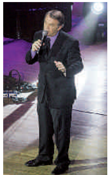
Απαράμιλλος ἐρωτικὸς τραγουδιστὴς ο Salvatore Adamo ἀποθεώθηκε ἀπὸ τὰ νιάτα τῶν '60 καὶ '70.

Ο ἴδιος ο Salvatore ἔχει περάσει μὴ σοβαρὴ ἐγκεφαλικὴ αἰμορραγία, ἀλλὰ τὴν ξεπέρασε, ἀνέρρωσε καὶ γυρίζει ἀνὰ τὰς πνεύρους τραγουδώντας καὶ χορευόντας, σαν νέος που ἦταν καὶ που εἶναι. Μαζί του, ξανάνωσε καὶ τὸ κοινὸ καὶ ὅσοι δὲν εἶχαν προλάβει νὰ... ἐρωτευθοῦν με τὸ «Je t' aime» του, συνειδητοποιήσαν τὶ σημαίνει νὰ 'σαι διαχρονικὸς καλλιτέχνης καὶ πόσο μεγάλο ρόλο παίζει, ἐκτὸς ἀπὸ τὴ φωνή, τὸ συναίσθημα καὶ ἡ μουσικὴ! «Merci, sas efxaristo poly-poly», ἔλεγε καὶ ξανάλεγε, ὑποκλινόμενος βαθύτατα, με τὸ χερὶ στὴν καρδιά. Ἀγρευοί, ἀγαπητὴ Ασπασία καὶ Ζορζ, Au revoir, Stavros Georgiannos –